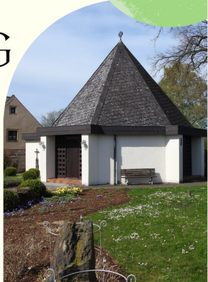
50 Jahre Kapelle Münchsreuth

Nach dem Gottesdienst Frührschoppen, Mittagessen sowie Kaffee & Kuchen. Bei schlechtem Wetter entfällt lediglich der Bittgang.